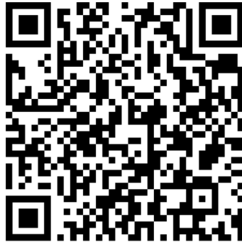
ประกาศ ผล ITA 63 (สถาบันอุดมศึกษา)

6. ประกาศสำนักงาน ป.ป.ช. เรื่อง ผลการประเมินคุณธรรมและความโปร่งใสในการดำเนินงานของหน่วยงานภาครัฐ (Integrity and Transparency Assessment: ITA) ประจำปีงบประมาณ พ.ศ. 2563 (ประเภทสถาบันอุดมศึกษา)