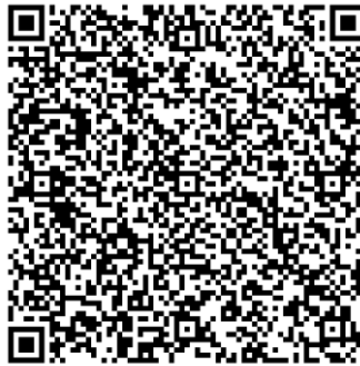
คำสั่ง ITA มจย. 64

https://qa.chandra.ac.th/files/pdf/ann/2563/1212-2563_%E0%B8%84%E0%B8%93%E0%B8%80%E0%B8%81%E0%B8%A3%E0%B8%A3%E0%B8%A1%E0%B8%81%E0%B8%B2%E0%B8%A3%E0%B9%80%E0%B8%95%E0%B8%A3%E0%B8%B5%E0%B8%A2%E0%B8%A1%E0%B8%0B%E0%B8%A3%E0%B8%B0%E0%B9%80%E0%B8%A1%E0%B8%B4%E0%B8%99_ITA_%E0%B8%9B%E0%B8%B5%E0%B8%87%E0%B8%9A2564.pdf